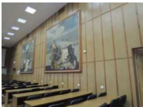
Зал заседаний Ученого совета матмеха