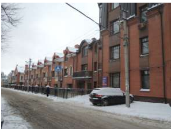
Это, видимо, таунхаус, совсем в английском стиле

В самом конце ноября в Москве и Санкт-Петербурге наконец-то началась зима, а я решила, что настало время для маленького путешествия из одной столицы в другую. Говорят, что в Питере было объявлено штормовое предупреждение, в пятницу, 30 ноября, и вправду погода не радовала: ветер, метель, но ничего особенного, а вот первого декабря случился настоящий зимний день. Снег, который выпал ночью и продолжал тихо падать весь день, был белым и пушистым, что, как вы понимаете, абсолютно нетипично для больших городов. Мои новосибирские друзья теперь живут в Питере, в замечательном месте. Это район бывшего Комендантского аэропорта (метро так и называется). Там, конечно, теперь стоят многоэтажки, широкие проспекты и прочее, но друзья привезли меня в удивительный микрорайон под названием «Никитинская усадьба».