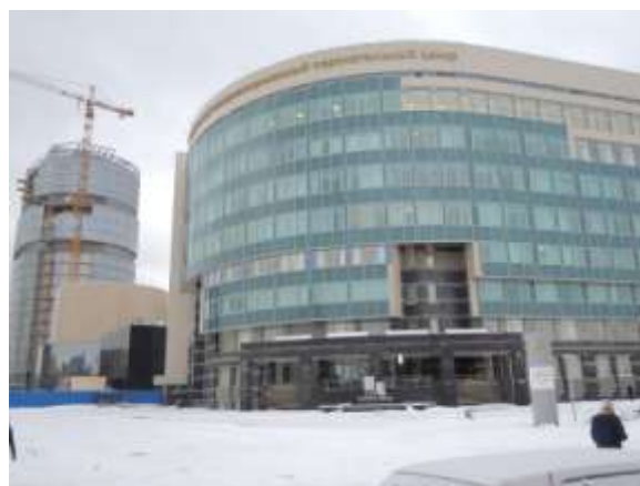
Совсем рядом строятся современные медицинские центры