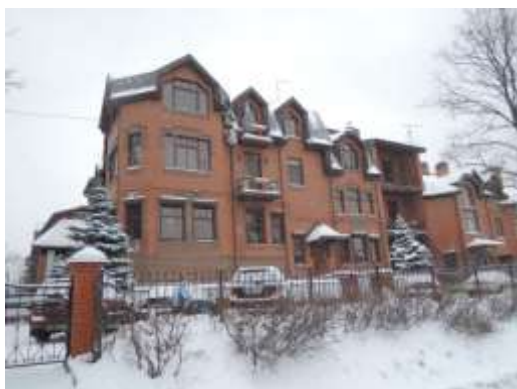
А это – просто загородная усадьба