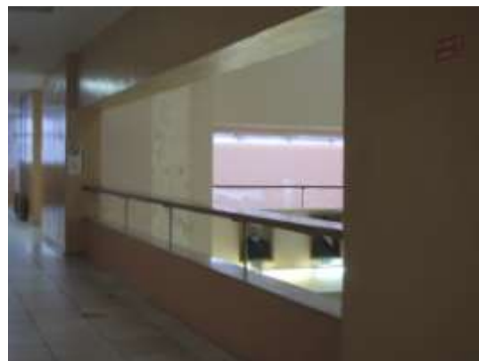
Вид сверху. Портреты великих математиков