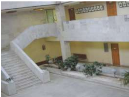
Мраморная лестница – парадный вход