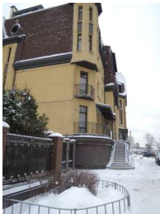
Архитекторы придумали интересную лестницу