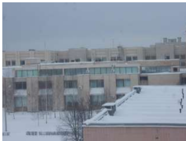
Вид из окна на противоположное крыло этого же здания